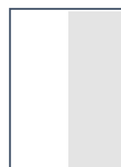
½ page Hauteur