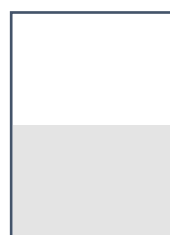
½ page Largeur